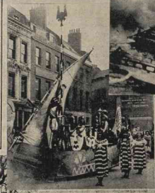
Una carroza representando una barca del tiempo de Tutankhamen y un grupo simbolizando las siete plagas de Egipto, que constituyeron dos de los números más admirados de la procesión celebrada recientemente en Londres, a beneficio del "Chelsea Arts Ball".