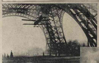
El teniente Collet volando en su aparato entre los arcos de la torre Eiffel, segundos antes de ocurrir el accidente que le costó la vida. —En el otro grabado aparecen el aparato del teniente Collet, envuelto en llamas, al pie de la Torre y la policía y espectadores haciendo esfuerzos por extraer el cuerpo del osado piloto.