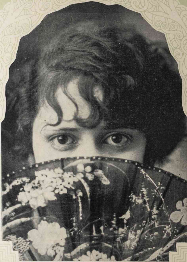
BOHEMIA tiene el galardón de haber organizado un concurso pleno de originalidad para saber cuál es la cubana de más lindos ojos. En nuestro último escrutinio ocupó el primer lugar la sobrina de un popular hombre público, que es senador por una de las provincias de Cuba. Tiene ella el número 18, una deliciosa juventud, con lozanía de primavera y unos ojos inmensamente tentadores...