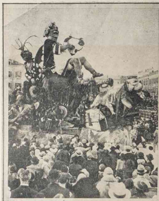
La carroza que conducía al Rey del Carnaval en su recorrido triunfal por las calles de Niza durante la celebración de los últimos carnavales. Este monarca es el 44° de tan humorística dinastía.