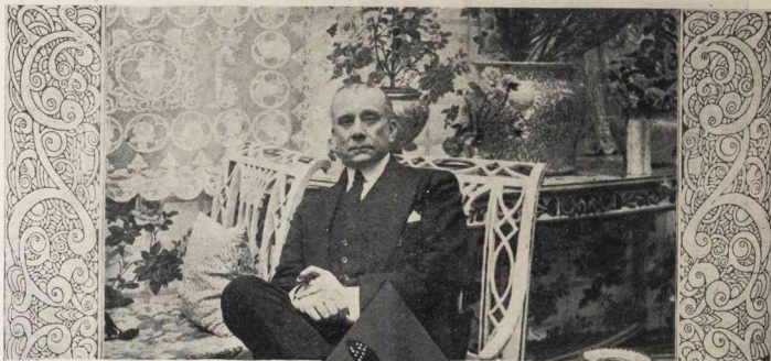
Última fotografía de Fernando Díaz de Mendoza, el insigne primer actor y director de la

compañía Guerrero-Mendoza, que a principios del próximo mes debutará en el "Nacional".