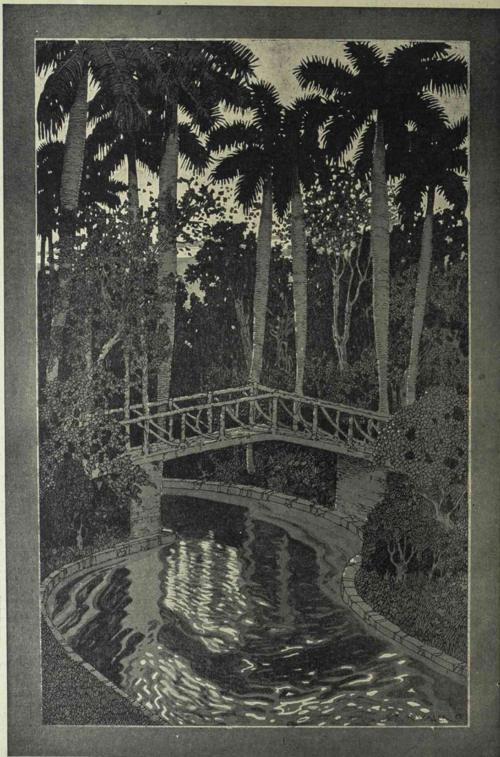
EL PUENTE DE LAS PALMAS