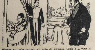
Watson no pudo reprimir un grito de sorpresa. Tenía a la vista la efigie de su antiguo amigo.

—Pero por qué no lo haces? —Porque no sé dónde está el diamante.